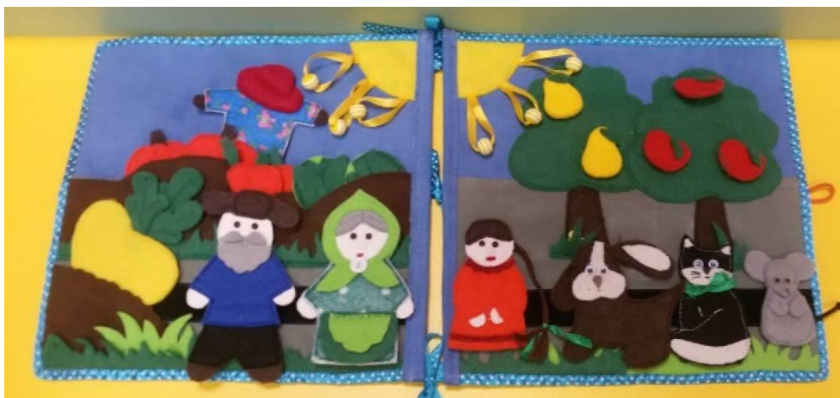
Совместный пересказ сказки «Репка» с помощью 3Д театра в лэпбук.

- Какую сказку я вам принесла? (Дети отвечают "Репка")